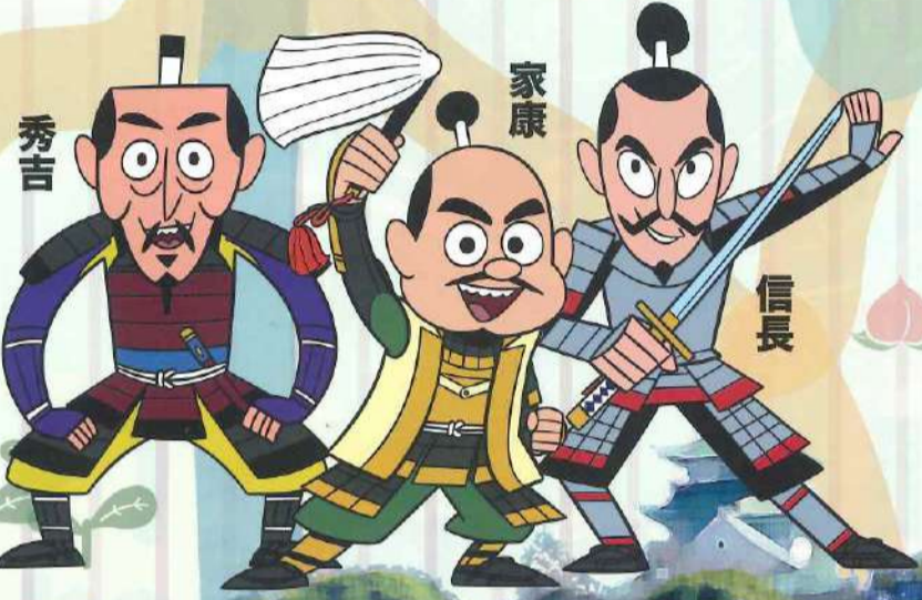
小牧山城PRキャラクター 小牧山城天下とり隊