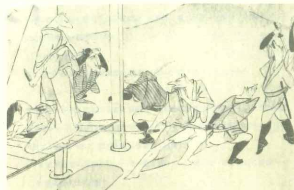
「伝説・老狐小牧山吉五郎」挿し絵 津田 北暮 氏筆