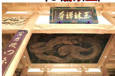
玉林寺 天井絵(イメージ)